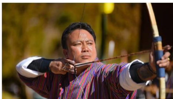
傳統國術 - 射箭