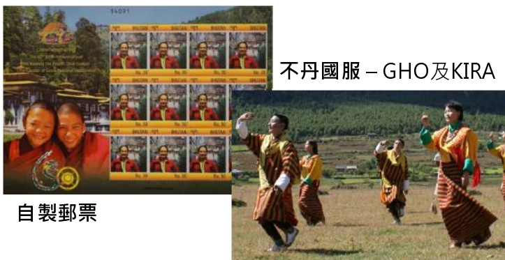
不丹國服 - GHO及KIRA