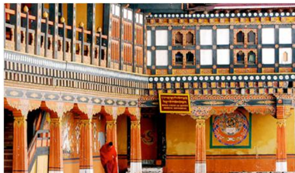
帕羅宗堡 - 國家辦事處僧侶學習之地