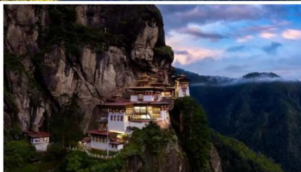
虎穴寺- 不丹必到勝地